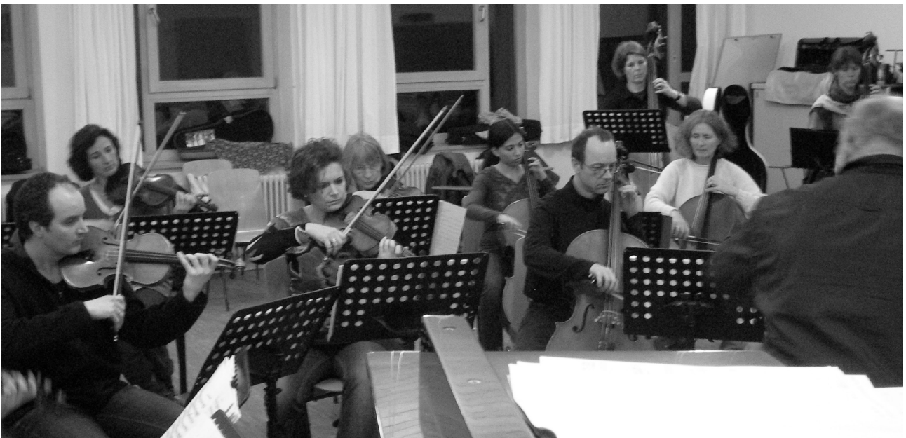
Probe am 1.3.2012

Die Anfangsjahre waren nicht nur eine Freude. Ich wusste ja nicht, wie debattierfreudig manch ein Mitglied des Ensembles war. Ist nun dieses Werk passend oder doch lieber jenes, wird ein Triller von oben oder doch besser von unten angefangen, soll man besser alle 14 Tage proben oder doch jede Woche ...? Eigentlich war ich immer der Meinung, dass der Dirigent mit seiner Persönlichkeit für die Wirkung und das Ergebnis der musikalischen Leistung gerade stehen muss, sobald man an die Öffentlichkeit geht. Wünsche kann man vielleicht äußern – aber diskutieren?