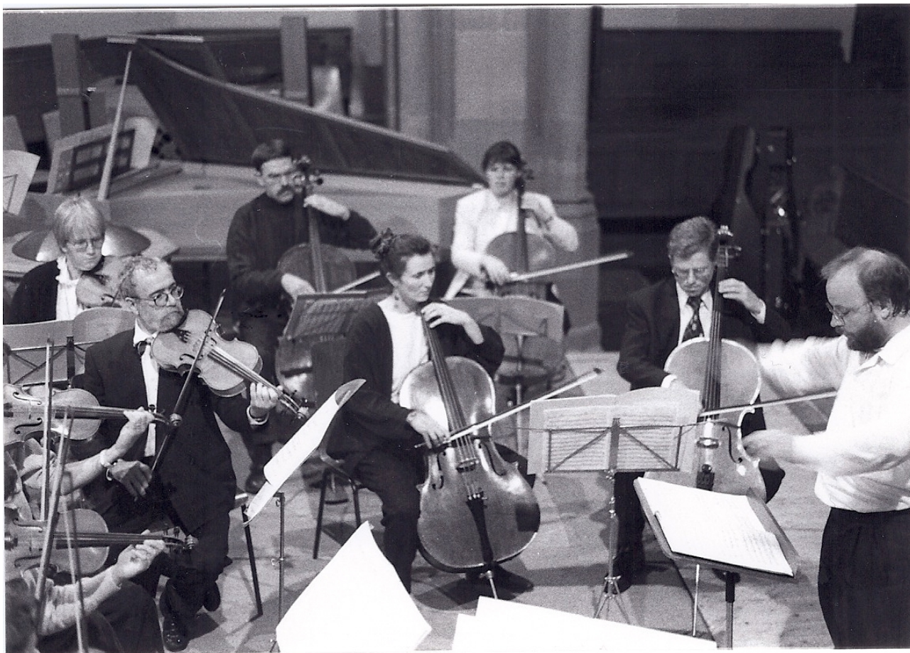
aus dem Jahr 1986

bekannten und großen Werke heran, die natürlich auf die Dauer nicht fehlen dürfen. Das Concertino hatte schon früh Unterstützung von Profimusikern, die als Komponisten, Solisten oder auch im Tutti für eine deutliche Steigerung der Leistung aber auch des Anspruchs gesorgt haben. Die vielfältigen Kontakte Dieter Barans waren hier unverzichtbar.