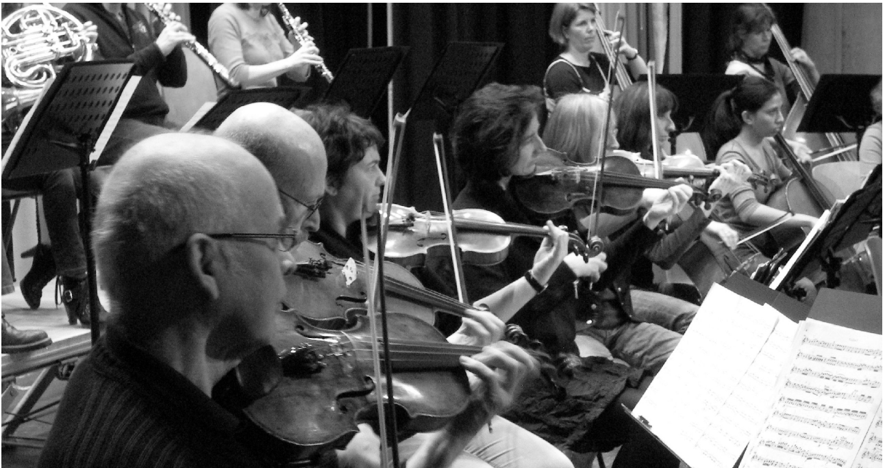
Generalprobe vom 3.März 2012

Zum Schluss möchte ich mich – ich denke im Namen aller „Concertinos“ – bei unserem Gastgeber, der Freien Waldorfschule Offenburg bedanken. Ich denke, dass wir wirklich zum kulturellen Leben einmal der Schule und zum anderen auch der Stadt Offenburg beigetragen haben. Unser Wunsch ist es, dies auch weiterhin zu tun.